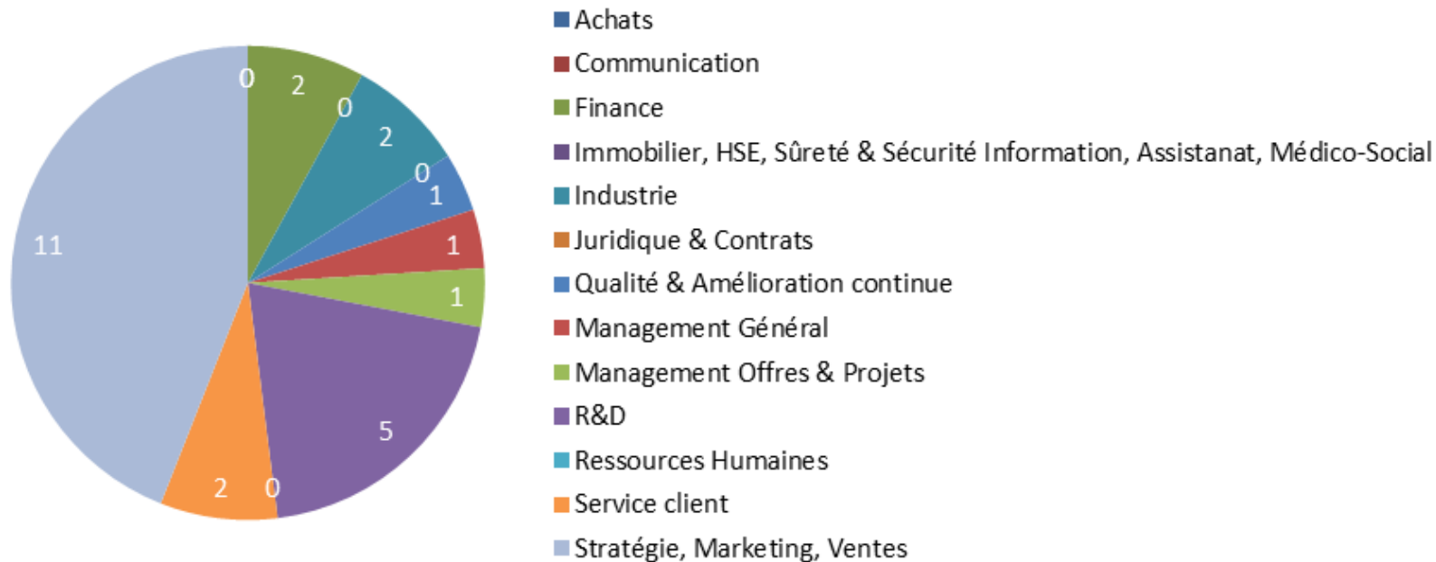
Cartographie métiers des détachements en cours et achevés