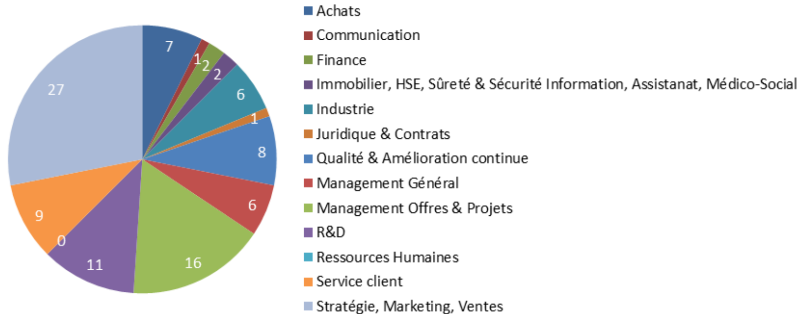
Cartographie métiers de l'ensemble des salariés volontaires